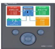
Color Control GX